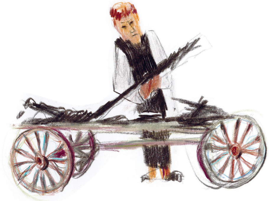
Im alten Zürichkrieg kam es 1443 zu Plünderungen im Kloster Kappel. 1493 zerstörte ein Brand Teile des Klosters. Mönch mit Wagen und verkohlten Brettern nach dem Brand 1493.