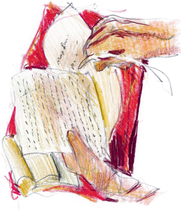
Bullingers Handschrift: Bekenntnissätze 1529.